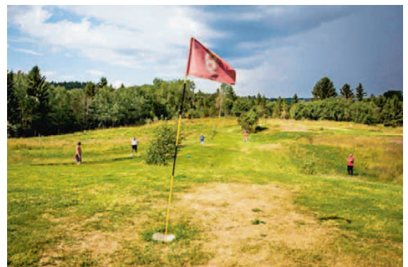
HULL ÅTTE. Fotballgolfbanen på Øyna er et av flere turisttilbud som er samlet i konseptet Den Gyldne Omvei.

20©14DagensNæringsliv grafikk/Kilde: NHO/Vista Analyse